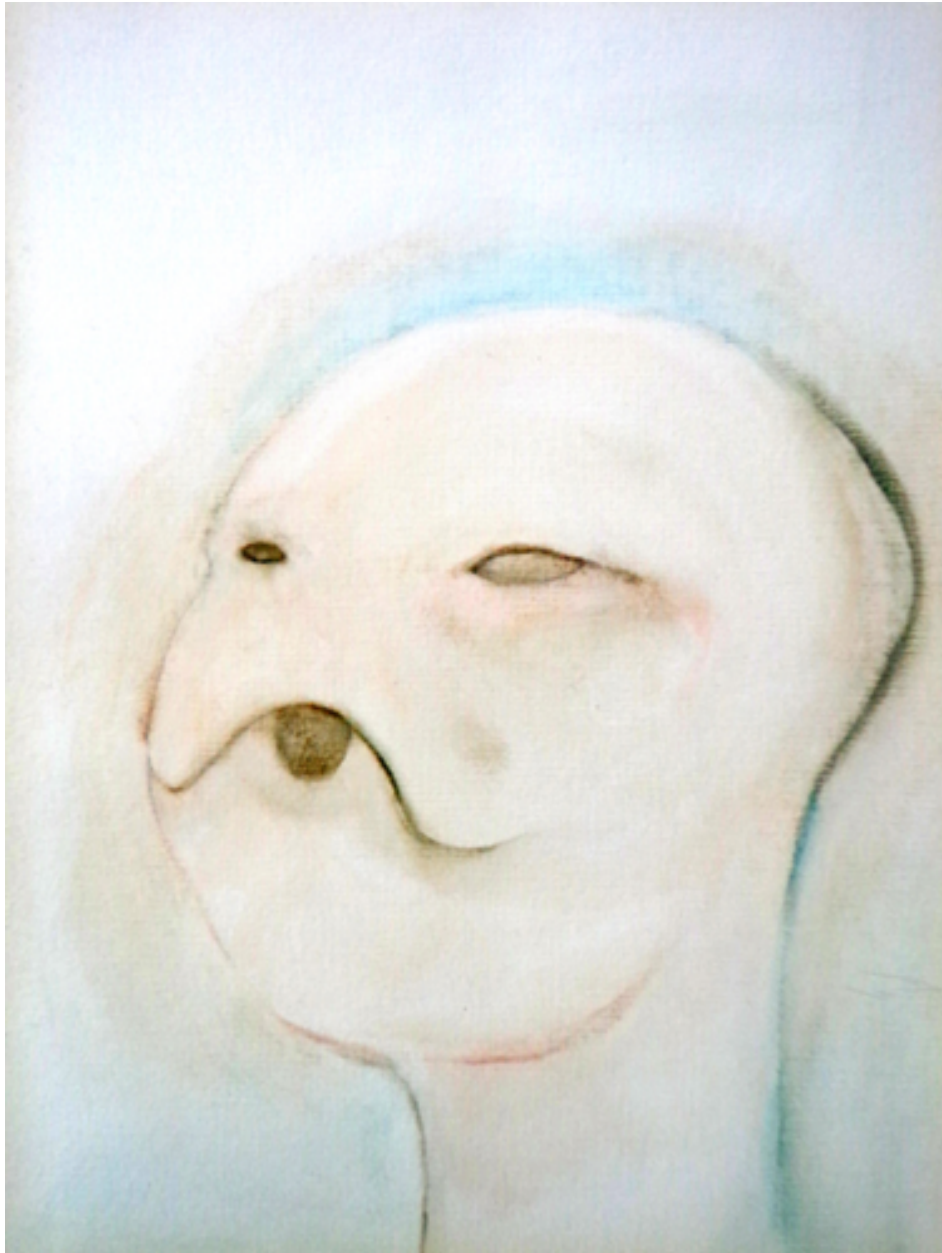
Cabeza japonesa., 2016. Óleo sobre madera 35x26cms