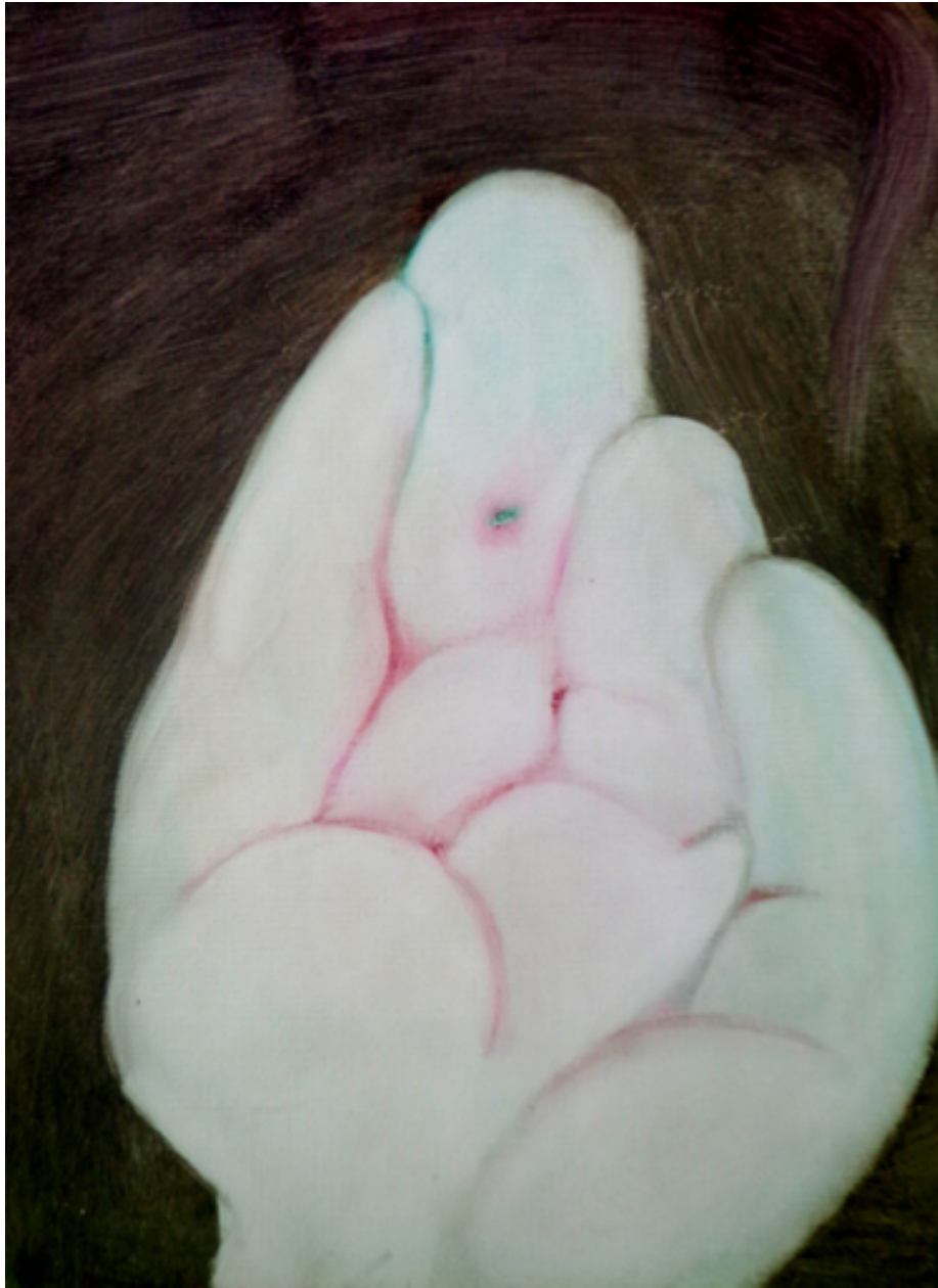
La mano del monje, 2016. Óleo sobre madera 36x25cms