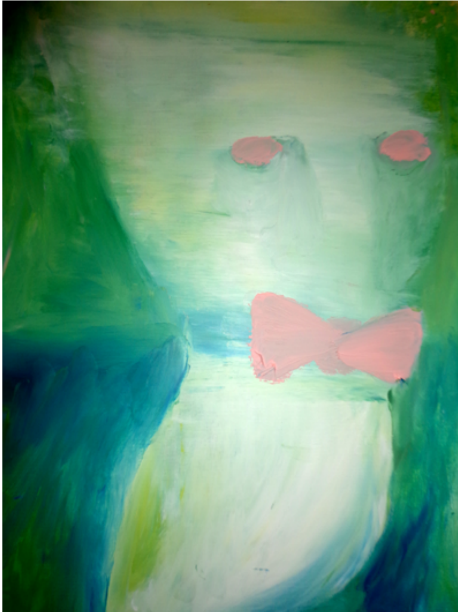
El gato, 2016. Óleo sobre madera 36x25cms