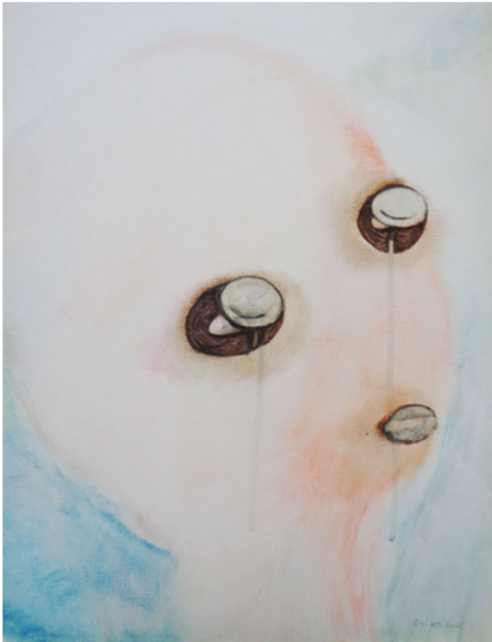
Ojos de piedra, 2016. Óleo sobre madera 35x26cms