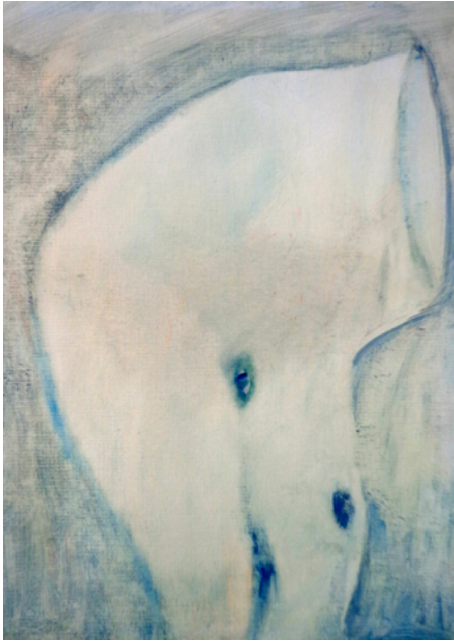
Piernas, 2016. Óleo sobre madera 35x26cms