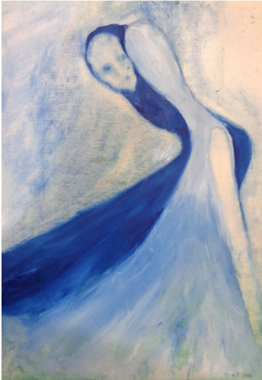
Mujer azul con su sombra. Óleo sobre madera 36x25cms