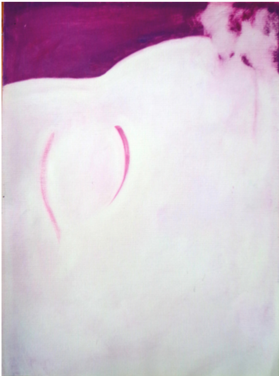
Último suspiro, 2016. Óleo sobre madera 35 x26cms