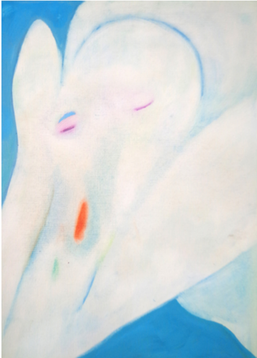
La nadadora, 2016. Óleo sobre madera 36x25cms